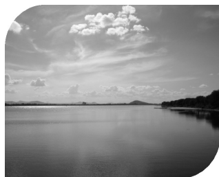
Foto 1 Vaso de la Presa Constitución 1917

Es importante señalar, por su importancia, que en el municipio se ubica gran parte de la superficie de Distrito de Riego 023 de la Comisión Nacional del Agua que en conjunto con sus unidades de riego y los pozos profundo debidamente electrificados, 25 en total para uso agrícola, hacen de San Juan del Río una de las regiones agrícolas más importante de la entidad, constituido por dos zonas agrícolas contiguas: la del propio DDR y Unidades de Riego que irrigan 8,900 hectáreas y, la de temporal, con 37,849 hectáreas, la mayor superficie de entidad. Por otra parte, San Juan Río junto con el fondo de tierras de los municipios de Pedro Escobedo, parte de Colón y el Marqués, representan el 60% de la actividad agroalimentaria de la entidad.