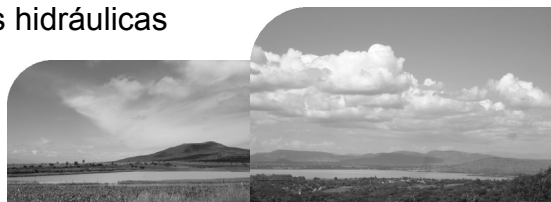
Foto 2 y 3 Panorámicas Vaso de la Presa Constitución 1917

Cabe señalar que en la entidad se localiza el 71.6% de la capacidad de almacenamiento de agua de la entidad con una infraestructura de 10 obras hidráulicas con capacidad superior a los 500 mil metros cúbicos de almacenamiento como se indica en el cuadro 3.1.