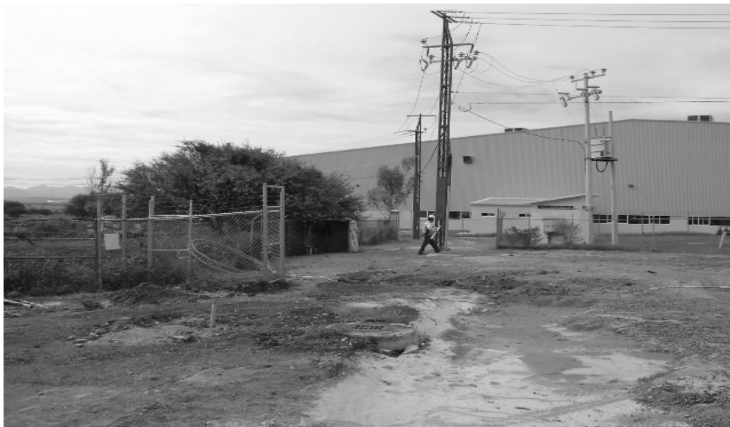
VIALIDAD EXISTENTE COLINDANTE AL FRACCIONAMIENTO