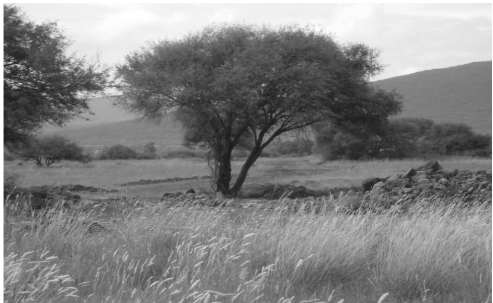
VISTA AL INTERIOR DEL PREDIO

3.- Asimismo se procedió a realizar una visita física al predio de referencia en el cual se pudo observar que el mismo se encuentra en su estado natural, y a la fecha no se han realizando ningún tipo de trabajos de construcción y/o obras de urbanización dentro del mismo, también físicamente se pudo constatar que no existe vialidad alguna dentro del predio; únicamente se localizaron caminos inter parcelarios sin consolidar y sin trazo alguno.