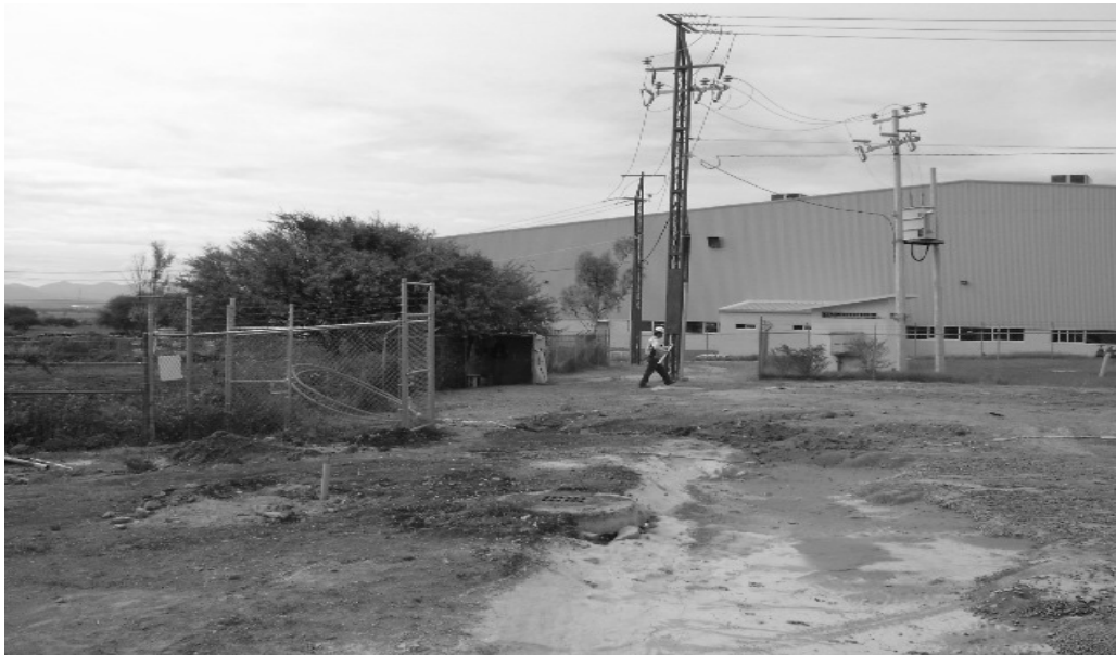
VIALIDAD EXISTENTE COLINDANTE AL FRACCIONAMIENTO