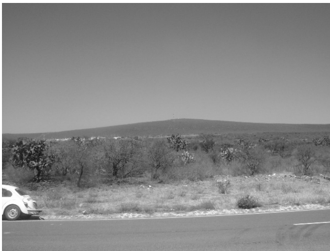
EL PREDIO DE REFERENCIA SE ENCUENTRA EN SU ESTADO NATURAL.

4.- Asimismo se procedió a realizar una visita física al predio de referencia por lo que se anexa el reporte fotográfico: