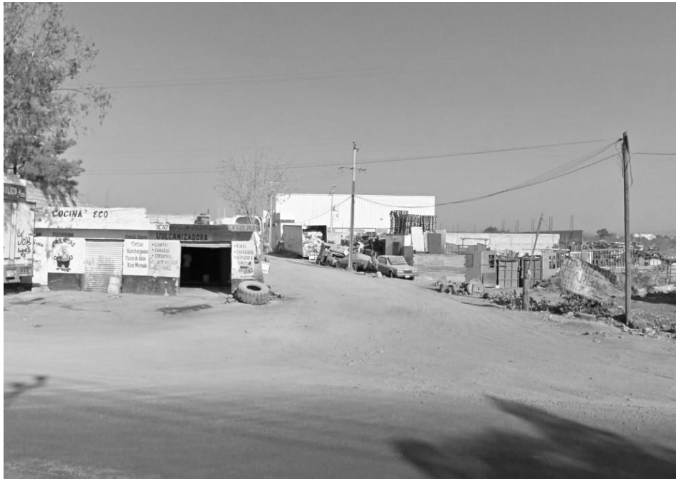
VISTA DEL CAMINO DE ACCESO AL POZO (TERRACERIA).