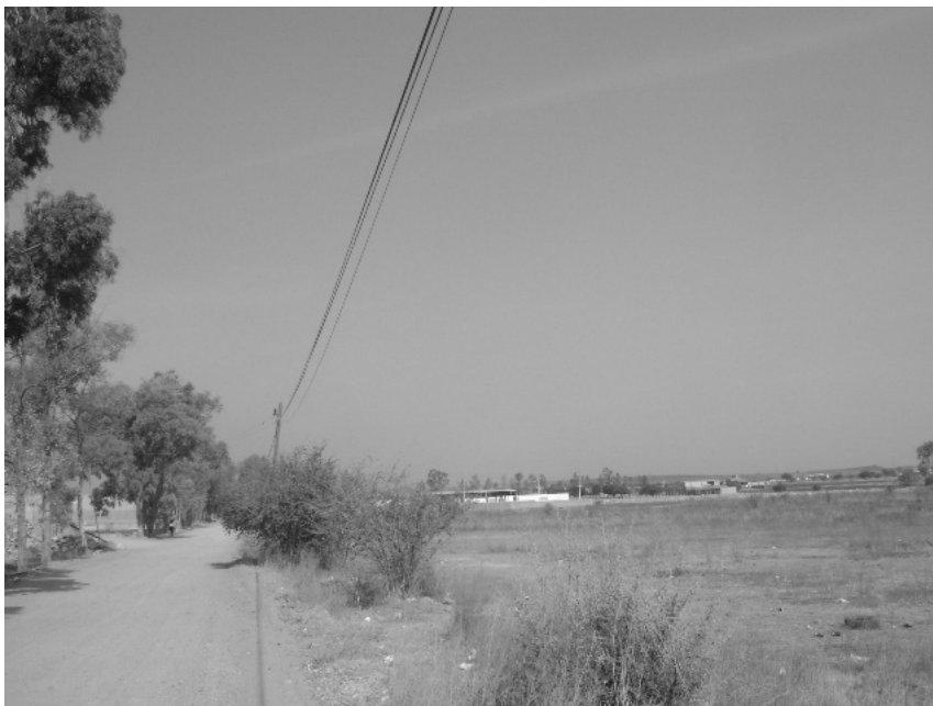
VISTA DEL PREDIO, QUE SE ENCUENTRA EN SU ESTADO NATURAL.

Asimismo se procedió a realizar una visita física al predio de referencia por lo que se anexa el reporte fotográfico: