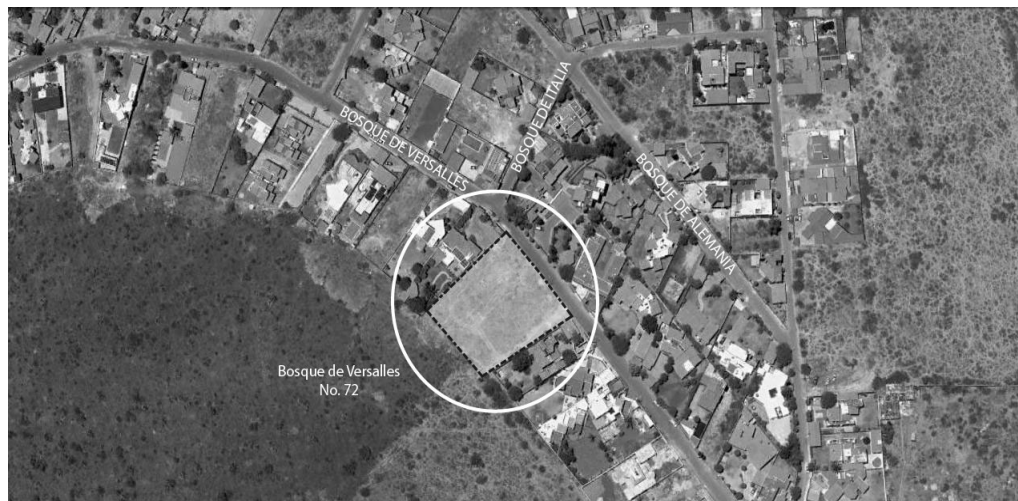
Fig. 1 Ubicación del predio

“...Una vez analizados los antecedentes presentados, esta Dependencia considera como técnicamente FACTIBLE el incremento de densidad de Habitacional con densidad de 50 hab/ha (H05) a Habitacional con densidad de 100 hab/ha (H1), para el predio